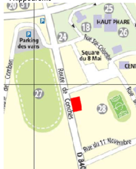
Localisation du futur hôtel près de l'hippodrome

L'objectif de l'implantation d'un nouvel hôtel est de pouvoir proposer un hébergement quantitatif et qualitatif suffisant compte tenu de l'activité économique et touristique en croissance sur le territoire de la CCPN.